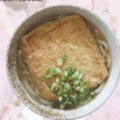
大判きつねうどん 480円 Bigsize deep-fried tohu Udon (soba)