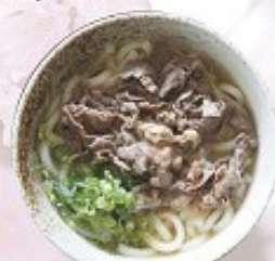
肉うどん 530円 Beef Udon (Soba)