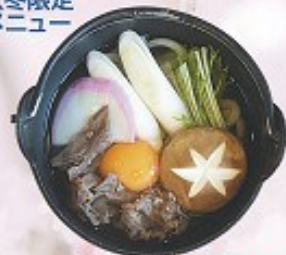
鍋焼きうどん 700円 Nabeyaki Udon