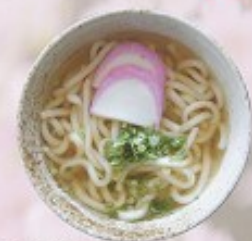
かけうどん 400円 Udon Noodle