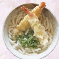
天ぷらうどん 670円 Tempura Udon (Soba)