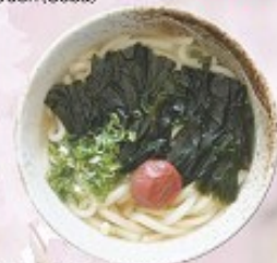
梅わかめうどん 480円 Plum & Seaweed Udon (Soba)