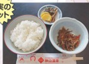
Set menu (rice+small bowl+pickles)