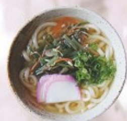
山菜うどん 500円 Edible wild plant Udon (Soba)