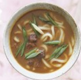
カレーうどん 670円 Curry Udon