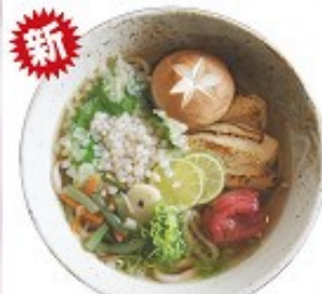
田舎のそば屋に嫁、すだち、神山鶏、 糠床、そば米など、神山の食材を すべてトッピング!! 790円